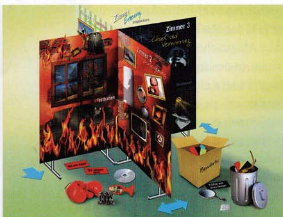
Requisiten für die Moderation von Change-Prozessen liefert der neue Workshop-Koffer „Vier Zimmer der Veränderung“.

Hauptbestandteil des Koffers sind acht Stoffbahnen zum Bespannen von Pinnwänden. So können Trainer in jedem Seminarraum die „Vier Zimmer der Veränderung“ entstehen lassen. Sie symbolisieren die vier Phasen, die Menschen in Veränderungsprozessen durchlaufen: